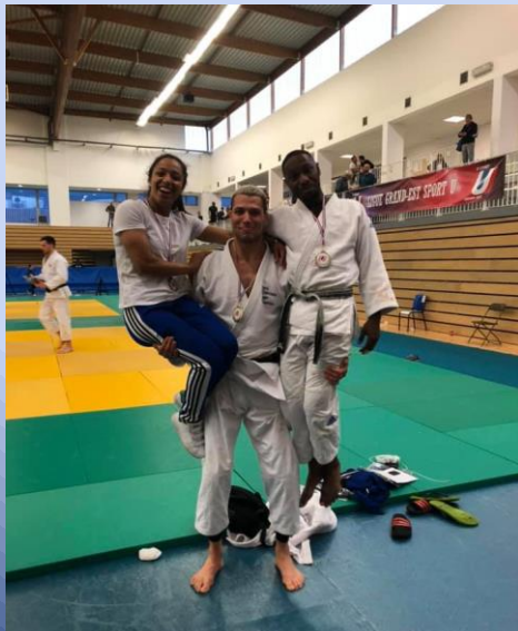
Les 3 podiums des championnats universitaires