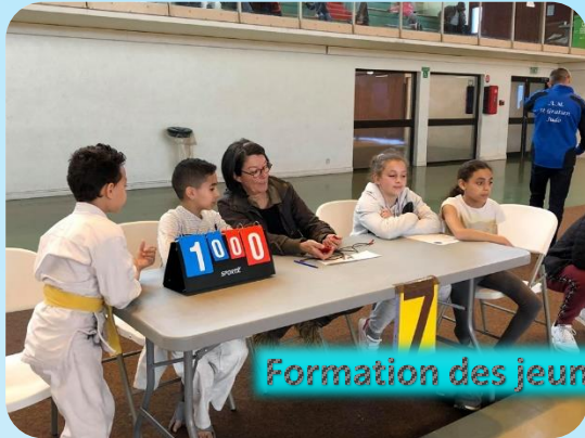
Formation des jeunes...