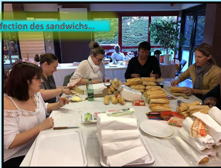
Confection des sandwichs...