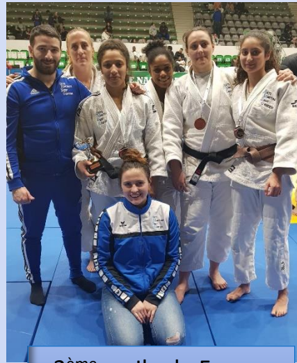
3 ème au Ile de France par équipe