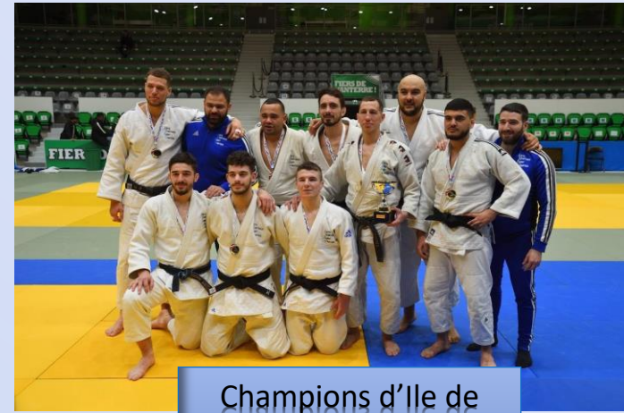
Champions d'Ile de France par équipe