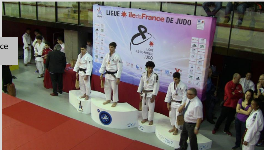
Ariles Vice-Champion d'Ile de France